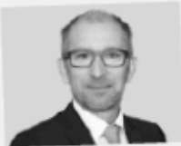
Plus Waser Leiter Niederlassung Küssnacht am Rigi